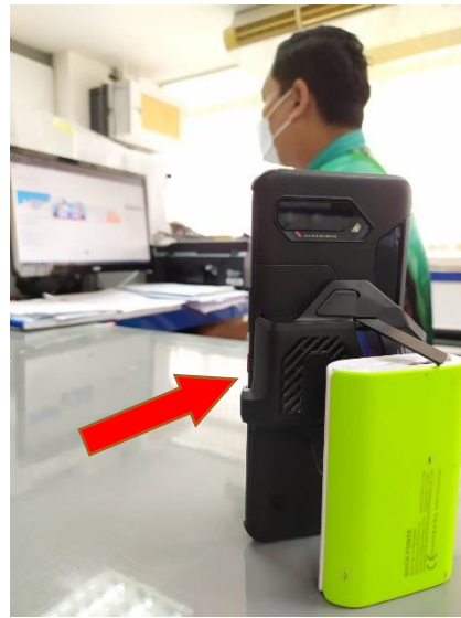
อุปกรณ์ชั้นที่ 2 ใช้เปิดโปรแกรม ZOOM Cloud Meetings